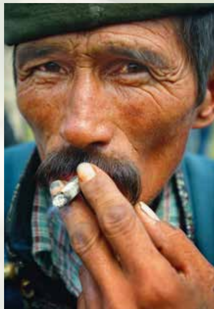
Narkotika er et stort problem i Iran, men våre TV-sendinger hjelper mange i frihet gjennom troen på Jesus.

sette dem i frihet. Vær med å be om at jeg kan tjene Gud med visdom og makt, og gi ære til Hans navn. Be om at jeg kan tjene mine narkomane landsmenn med kjærlighet og omsorg, og be om frihet for Iran.