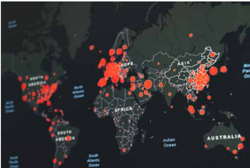
COVID-19 har spredd seg til store deler av verden.

vært pålagt å sitte i karantene i lange perioder dette året. – Midt i frykten og mørket vi opplever akkurat nå, har Gud lagt på hjertet mitt at det er håp. Dette er det jeg ønsker å formidle til kvinner gjennom radioprogrammene, avslutter Joud. Hun har laget en ny serie, basert på alle spørsmålene som blir stilt på sosiale medier. Hun erfarer at mange er trøtte, og at de trenger et trøstende budskap.