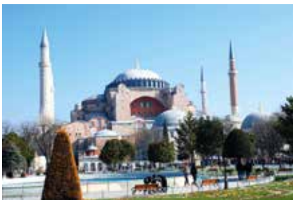
Den kjente Haga Sophia katedralen i Istanbul, bygd rundt år 500.

Noreas TV-partner SAT-7 var på lufta bare timer etter eksplosjonen i Beirut. Deres direktesendinger med mulighet for å ringe inn sine historier, få forbønn og trøst har vist seg å gi nytt mot og håp til den hardt prøvede befolkningen i det lille landet Libanon. Norea besluttet å kjøre en ekstraordinær innsamling til disse viktige TV-sendingene. Fortsatt kommer det gaver, og så langt har vi passert en halv million kroner!