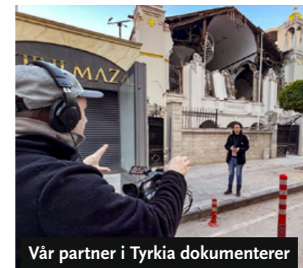
Vår partner i Tyrkia dokumenterer ved hjelp av filmer den kristne arven i landet.

TV-sendingene til SAT-7 Turk finnes også på Türksat 4A på 42 grader øst, 12.264 GHz Vertical.