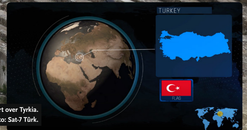
Kart over Tyrkia.

«Hallo! Først av alt vil jeg takke dere så mye for at dere tok kontakt med meg og viste omsorg for problemet mitt. Jeg har ikke ord for hvor oppmuntrende det var for meg. Kan dere be for min kone også? Tusen takk!»