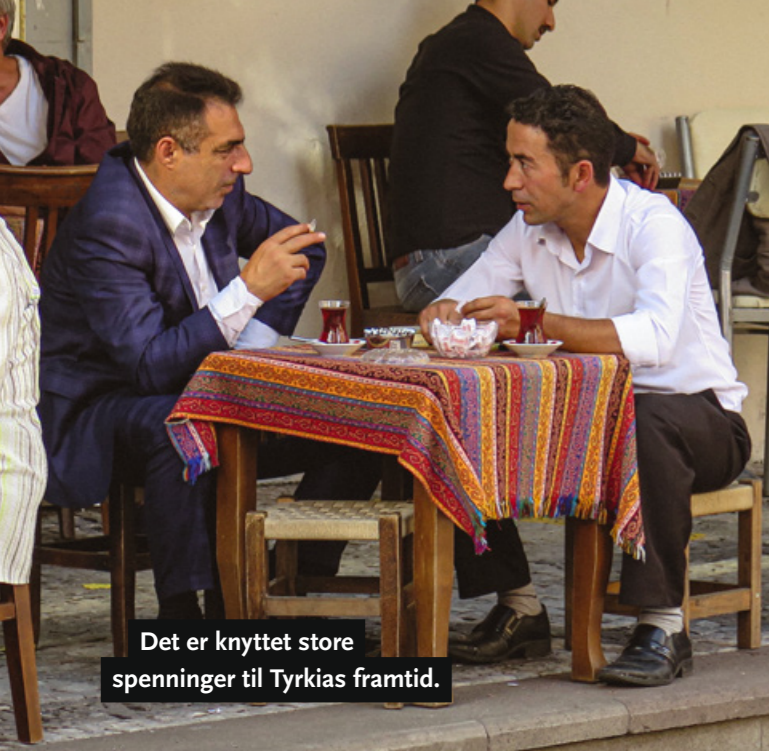
Det er knyttet store spenninger til Tyrkias framtid.

Til tross for ekstrem inflasjon, en skrantende økonomi og ikke minst jordskjelvet i februar, fikk president Erdogan fornyet tillit i 5 år. Han får en tøff jobb, tror vår kontakt i Tyrkia, for mandatet er skralt, og landet er delt i to.