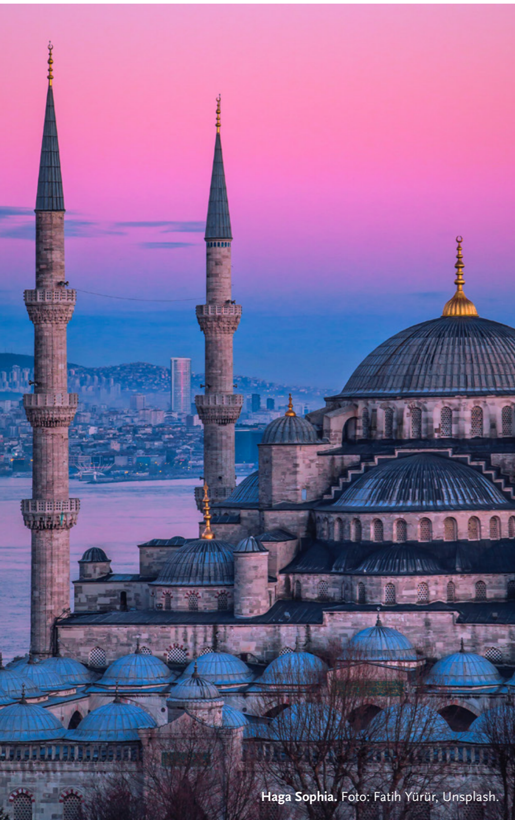
Haga Sophia.