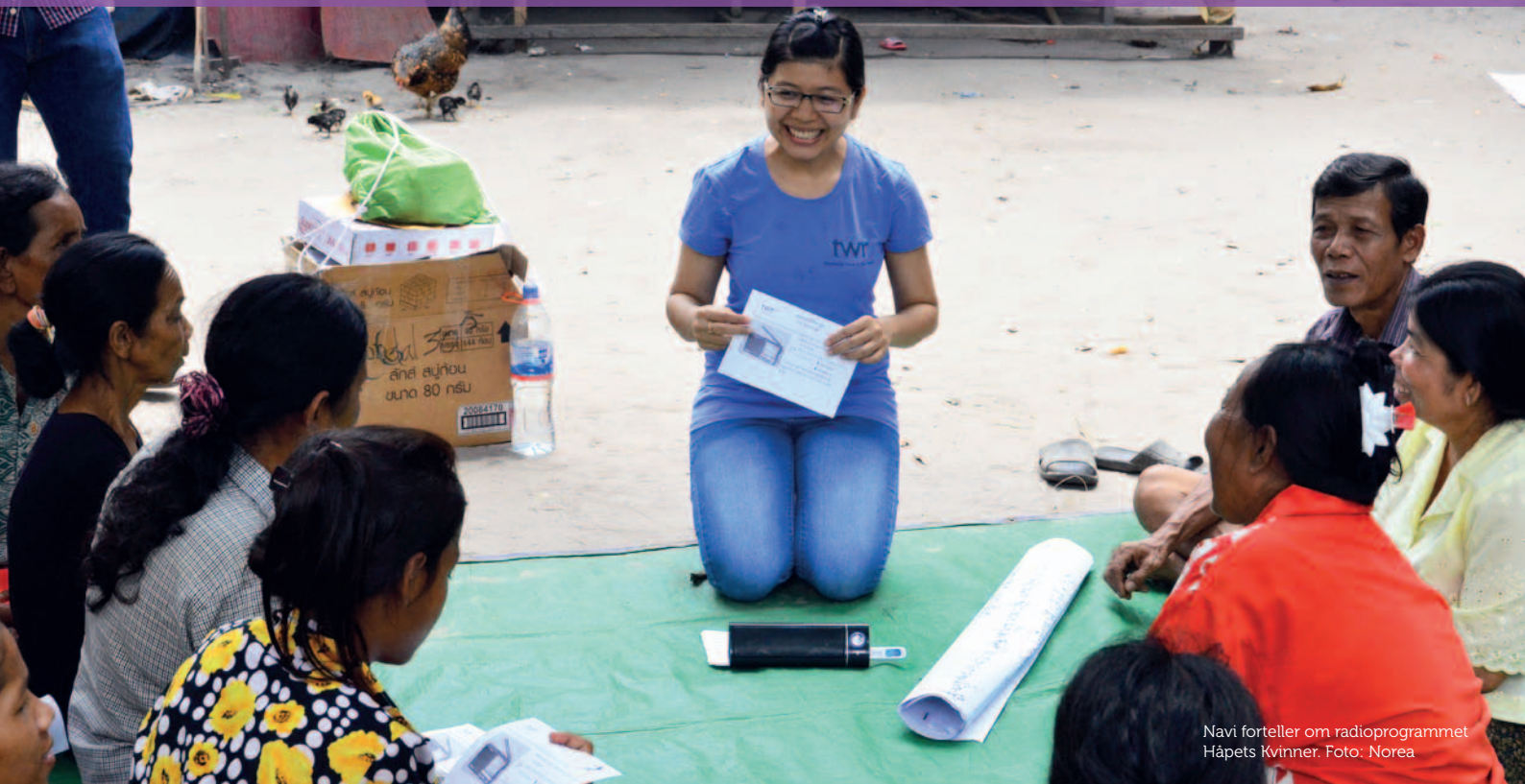
Navi forteller om radioprogrammet Håpets Kvinner.