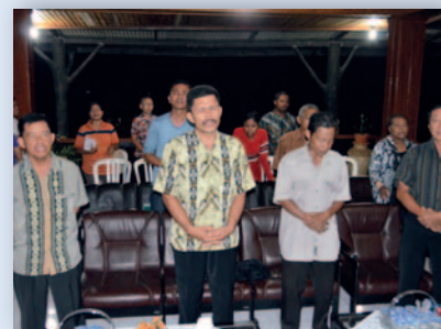
Det er ofte lovsangsmøter i stua til ekteparet