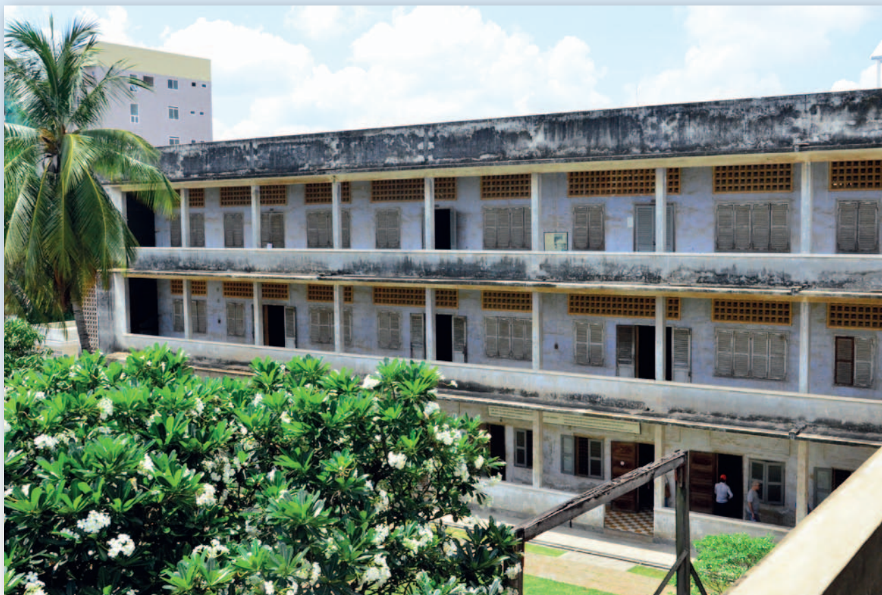
Dette er S-21, eller Security office 21, som var det største fengslet under Røde-Khmer tiden. Opprinnelig var det en skole. Klasserommene på bakkenivå var enkeltceller hvor fanger ble holdt innimellom torturen. Mange tusen ble drept her av Røde Khmer-soldater. Tortur-redskapene er der fortsatt, og man kan fortsatt se blodet på gulvene.