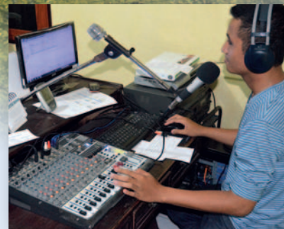
Radiostudioet til RSKO.

Nå om dagen drømmer ekteparet og radiostaben om penger til å pusse opp radiolokalene. Norea og Sentosa gav dem en startkapital på rundt 2.500 kroner mens vi var der. Det blir spennende å se hvordan det vil gå med radioen fremover, men det er helt klart at radioen er et viktig redskap i Jesu tjeneste her i byen Biak.