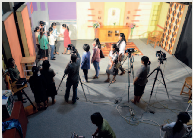
Bildene er fra det store TV-studioet til Studio Sentosa, Noreas partner i Indonesia.

en venn eller bekjent. Selv om de er svært negative til kristen tro så er nysgjerrigheten vekket, og det enkleste da er å søke mer informasjon gjennom media. På den måten sørger kristne media for å vanne den lille spiren av tro som er sådd, så den kan vokse seg større. Media gir også kristne en stemme inn i miljøer som ikke møter kristne til vanlig.