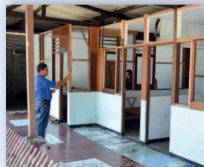
Det gamle radiostudioet som skal renoveres.

Det koster 250 kroner pr. program produsert av vår partner i Indonesia. Hvor mange programmer vil du ta ansvaret for?