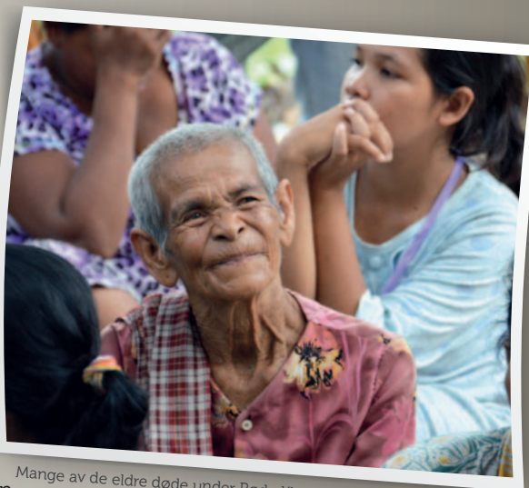
Mange av de eldre døde under Røde Khmertiden på slutten av 1970-tallet.